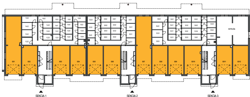
Obrázok č. 1: Garáže prístupné zvonku v dome Z4

Ceny jednotlivých vonkajších garáží prístupných zvonku nájdete v cenníku nižšie.