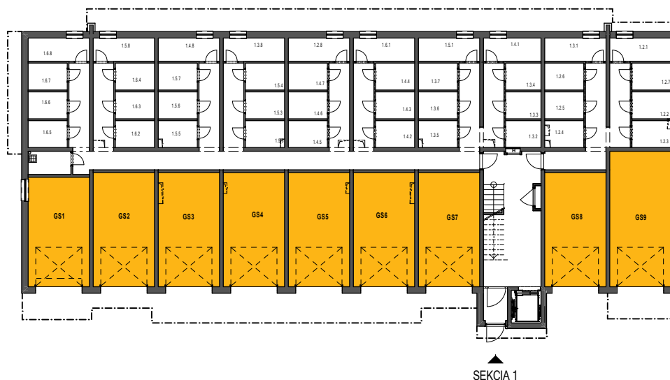
Obrázok č. 2: Garáže prístupné zvonku v dome Z5

Ceny jednotlivých vonkajších garáží prístupných zvonku nájdete v cenníku nižšie.